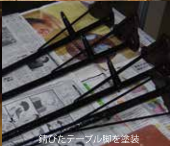
錆びたテーブル脚を塗装

ア ンティーク家具の修理・リメイクをはじめました。少し傷んでいるもの、取っ手等がないものなど、少し手を加えるだけで格段に良くなる家具があります。写真のように錆びたテーブルの脚を塗装、傷んだ天板を新しく替えたりすることにも挑戦しました。木目をきれいに見せるために「グレープシードオイル」をよく使います。食用ですが、完全に乾燥するので木工用のオイルと同様な使い方ができます。安くて手軽でおススメです。