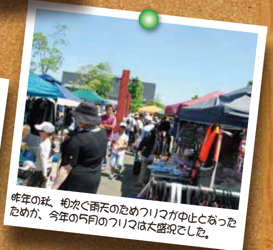
昨年の秋、相次ぐ雨天のためつりなが中止となった ためか、今年の5月のつりなが大盛況でした。