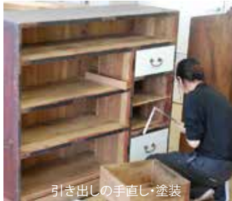
引き出しの手直し・塗装

再生工房を運営する耳納ねっと！がお届けする情報誌 平成16年から、うきは市、田主丸町でエコ活動やっています！