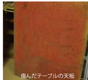
傷んだテーブルの天板

ア ンティーク家具の修理・リメイクをはじめました。少し傷んでいるもの、取っ手等がないものなど、少し手を加えるだけで格段に良くなる家具があります。写真のように錆びたテーブルの脚を塗装、傷んだ天板を新しく替えたりすることにも挑戦しました。木目をきれいに見せるために「グレープシードオイル」をよく使います。食用ですが、完全に乾燥するので木工用のオイルと同様な使い方ができます。安くて手軽でおススメです。