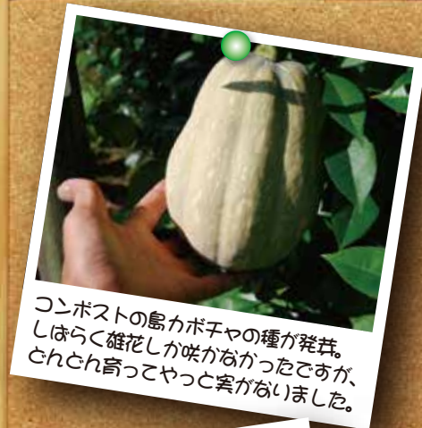
コンポストの島カボチャの種が発芽。 しばらく雄花しか咲かなかったのですが、 とんとん寄ってやっと実がなりました。