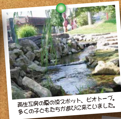
再生工房の夏の涼スポット、ビオトープ。 多くの子どもたちが遊びに来ていました。