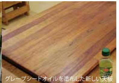
グレープシードオイルを塗布した新しい天板