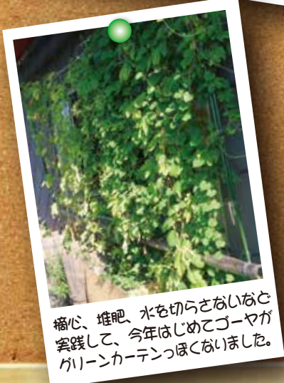
摘心、堆肥、水を切らさないなど 実践して、今年のはじめてゴーヤが グリーンカーテンっぽくなりました。