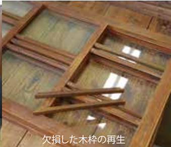
欠損した木枠の再生