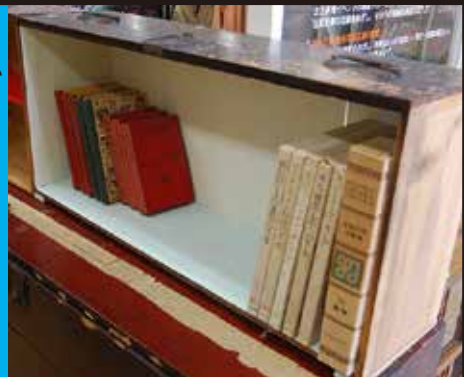
→ 和箆笥の引出の内側を塗装して本立てに。