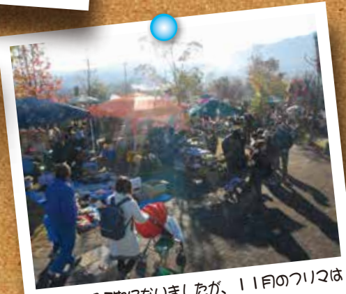
雨で1週間延期になりましたが、11月のつり又はおかげさまで大盛況でした。