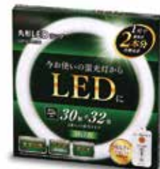
LEDは蛍光灯の約5倍の寿命