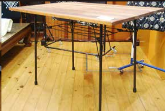
← 傷んだ天板を取り外して新しい板と交換。足の部分が酷く錆びていたので塗装しました。