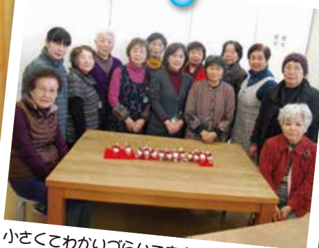
小さくてかわいらしいですが平成30年の干支「戌」(いぬ)をつくりました。