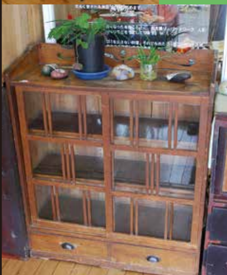
↑ 和箆笥の引出をすべて取り外し塗装して新たな棚にリメイク。