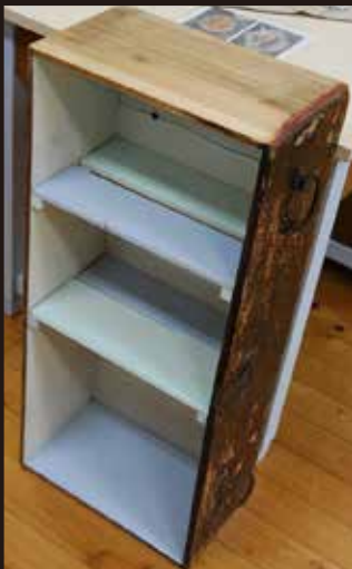
← 和箆笥の内側に棚板を設け塗装した棚。