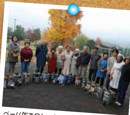
ペール缶でロケットストーブをつくりました。屋外で煮炊きができ、木廃材が燃料になる優れたものです。