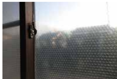
窓に「プチプチ」を貼ると断熱効果があります。