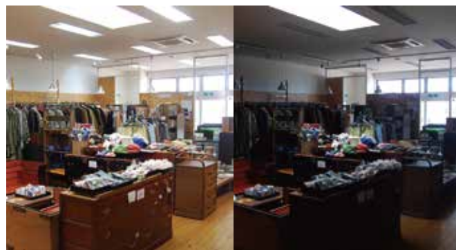
右は再生工房の昼間消灯した状態。天窗の下以外は商品の色などよく分からない。

理由付けができて、皆さんの利益となり、続けることができる省エネを実行しましょう。