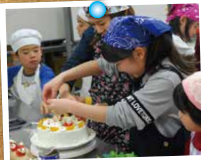
毎年大好評の子供会のクリスマスケーキ作りです。デコレーションしたい、苺でサンタさんをつくったりとても楽しそう。