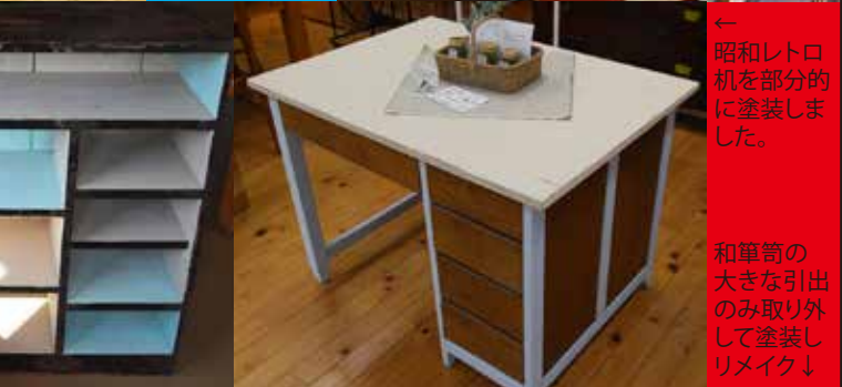
← 昭和レトロ机を部分的に塗装しました。