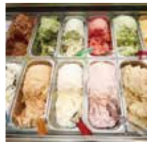
ソルベッチdoうきは フルーツたっぷりアイスの開発秘話をお聞かせします。