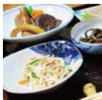
農家民宿馬場のランチ うきはの食材をたっぷりご堪能ください