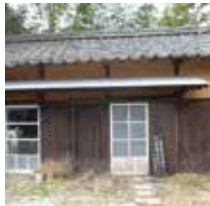
こね屋チゾン うきはのフルーツでつくった天然酵母パンのお話