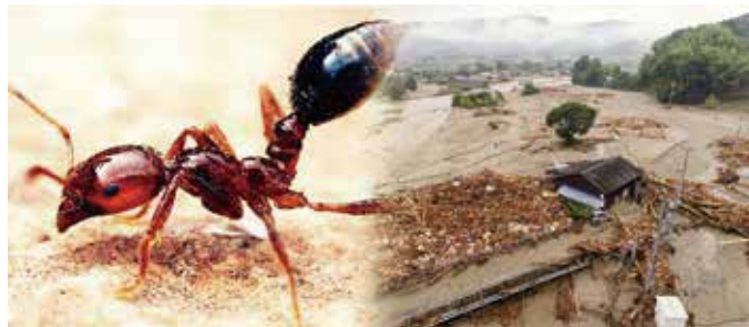
左：外来生物のヒアリ 温暖な地域の生物だが日本の冬を越し、住み着いたともいわれている。 右：海面の温度上昇により昨年の九州北部豪雨のような豪雨災害が増えてきたともいわれている。

そのころ温暖化は遠い所の話で、身近なものではありませんでした。現在は温暖化の影響が、気候であったり農業であったり外来種であったり、いろんなところで現れています。