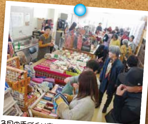
3月の手づくり市はお天気も良く大盛況でした。来場客の年齢層の幅が広いのも特徴の一つ。