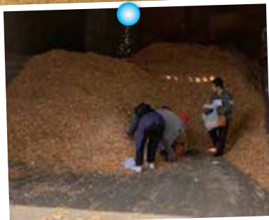
社会科見学ツアー-見学先の堤木材さんでは杉のいい香りがある杉チツブのおみやげも詰め放題でいただきました。

HP http://uk-kankyuu.jp/publics/index/24/