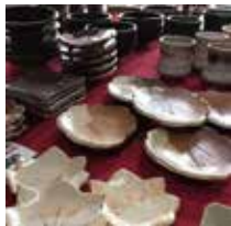
陶秀苑(一の瀬焼) 食は食でも食器をとりあげてみたいと思います。