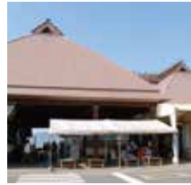
道の駅うきははでお買い物 お気に入りのうきはの食をお土産に!