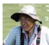
福岡県地球温暖化防止活動推進員 環境カウンセラー（市民部門） ヒナモロコ親会 代表 耳納ねっと！会員

（注 1）推進員は原則自治体に 1 人、人口10万人を越すごとに 1 人増員。 久留米市は人口約30万人ですので 4 人となります。