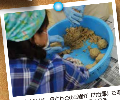
お味噌づくりは、ほとんどの工程が「力仕事」です。写真は大豆の玉を丸く強く固めているところ。