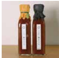
なないろわおん テレビでも話題になった特ソースはどやうやって生まれたか