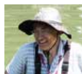
福岡県地球温暖化防止活動推進員 ヒナモロコ里親会 会員 耳納ねっと！会員