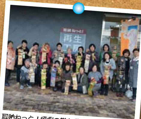
耳納ねっと!恒例の帯を使った教室。今回は 彩り鮮やかなお正月飾りをつくりました。