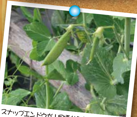
スナックエンドウが1月頃から実をつけました。 地球温暖化はあぐそこまで来てるのか?