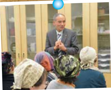
12/14の柿を使った料理教室にはゲストとして うきは市長も来られ、うきは農業の 未来のお話をいただきました。