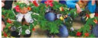
ヒノキの葉とカスラでつくる本格クリスマスリース