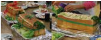
クリスマスボックスサンドイッチ