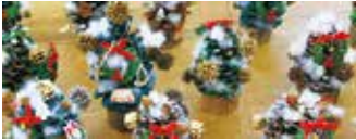
巨大松ぼっくりのクリスマスツリー