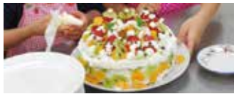
クリスマスパーティーの定番！クリスマスケーキ